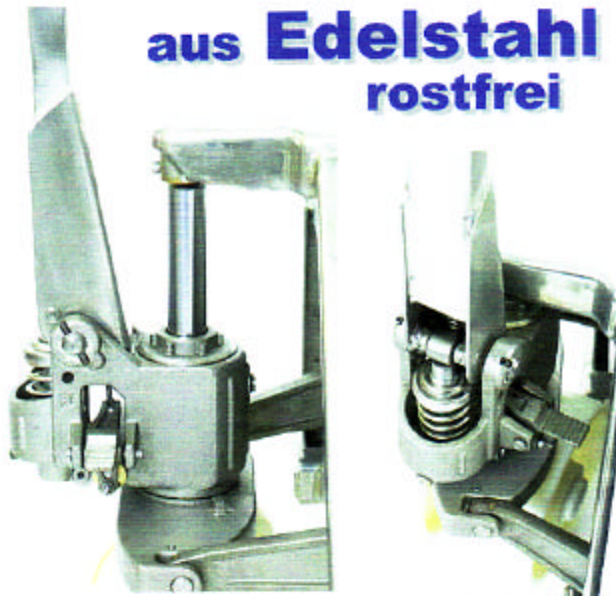
nur 3 mal Pumpen und schon fahrbereit